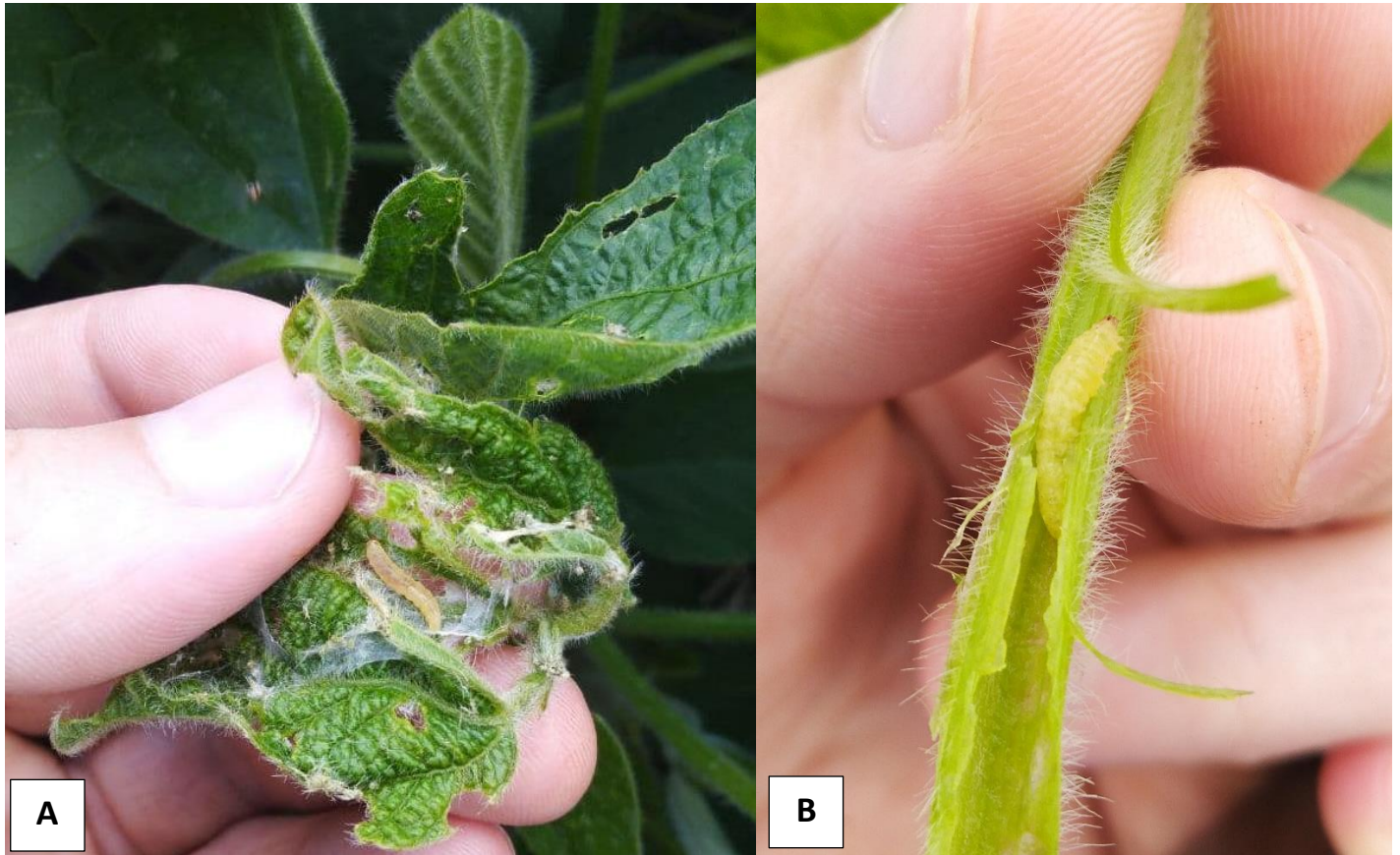
Figura 2. Ataque da broca-das-axilas nos ponteiros (A) e pecíolos (B) de plantas de soja.

Apesar desta preocupação para o sojicultor, é importante destacar que populações de lagartas resistentes ao Cry1Ac foram observadas até o momento apenas para a broca-das-axilas e também para Rachiplusia nu até o momento e essa resistência não deve impactar a performance da tecnologia de soja-Bt para o manejo das outras espécies alvos da tecnologia.